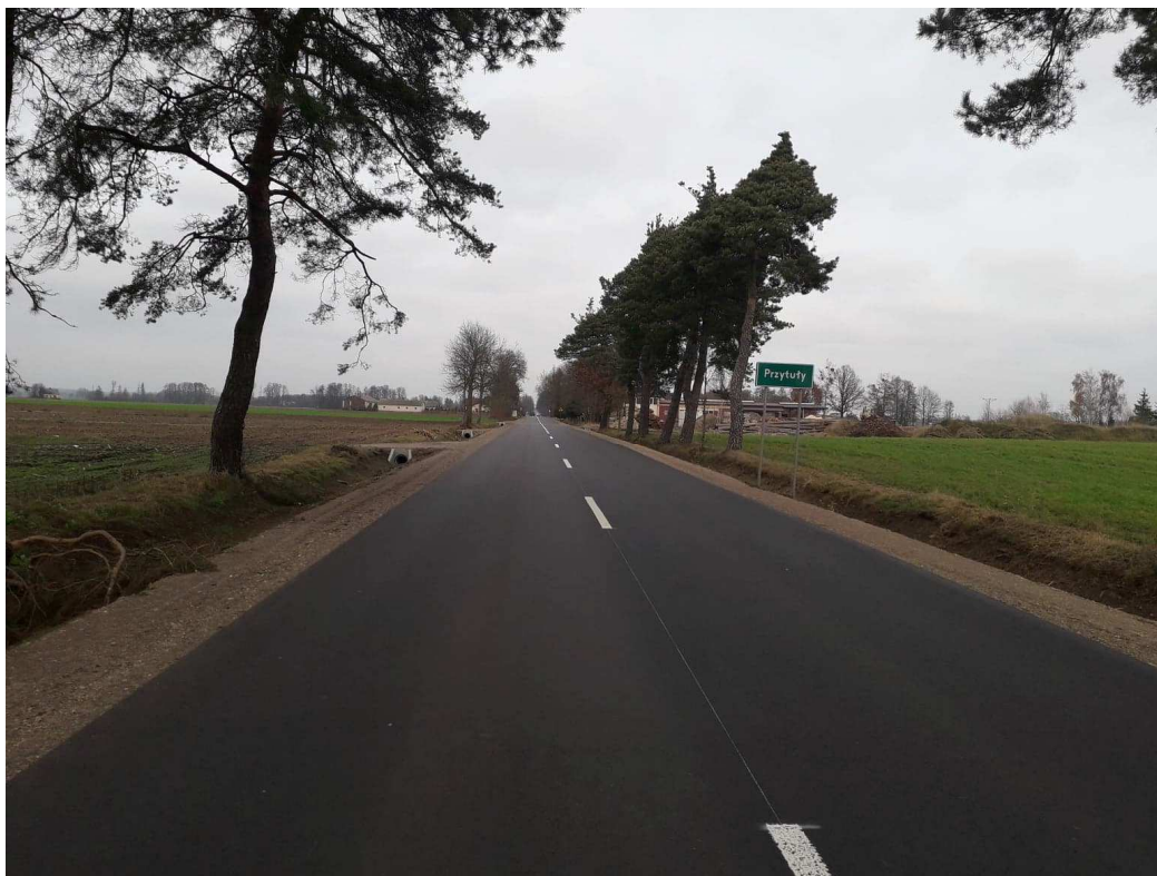
Przebudowa drogi powiatowej nr 2116W Czerwonka – Guty Duże – Sławkowo od km 0+000 do km 11+802, odcinek o długości 11,802 km