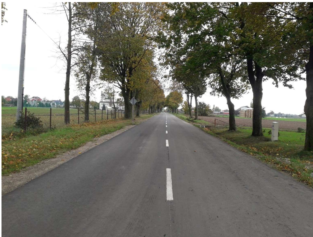
Budowa chodnika w ciągu drogi powiatowej nr 2128W Różan –Dzbańdz – Brzuze – Rzewnie – Łaś na ulicy Królowej Bony w miejscowości Różan