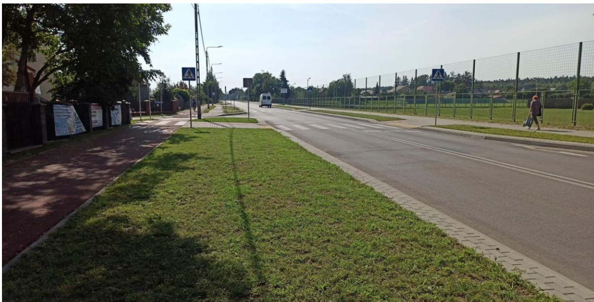
Przebudowa drogi powiatowej nr 2102W Kaszewiec - Chelsty - Jawory Stare na odcinku o długości 4,350 km zadanie rozpoczęte i zakończone w 2022 roku